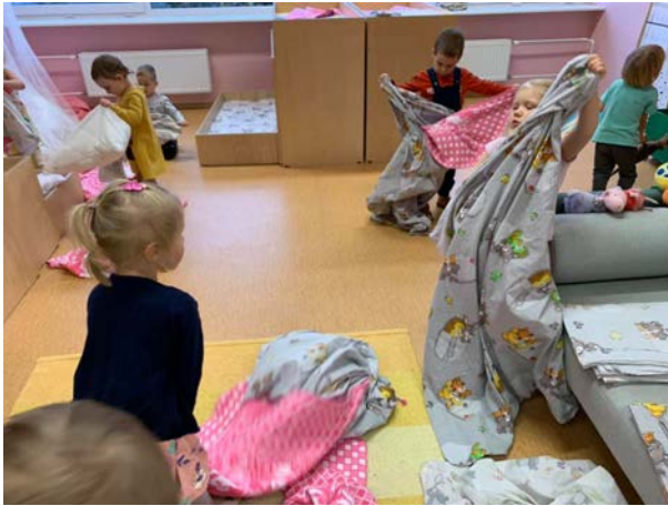
Rõõmutirtsud voodipesu vahetamas

kellel on suurem kohanemisvõime, on sellega kergem toime tulla, kuid järjepidevus ja laste kaasamise mõjust aru saamine on suureks abiks.