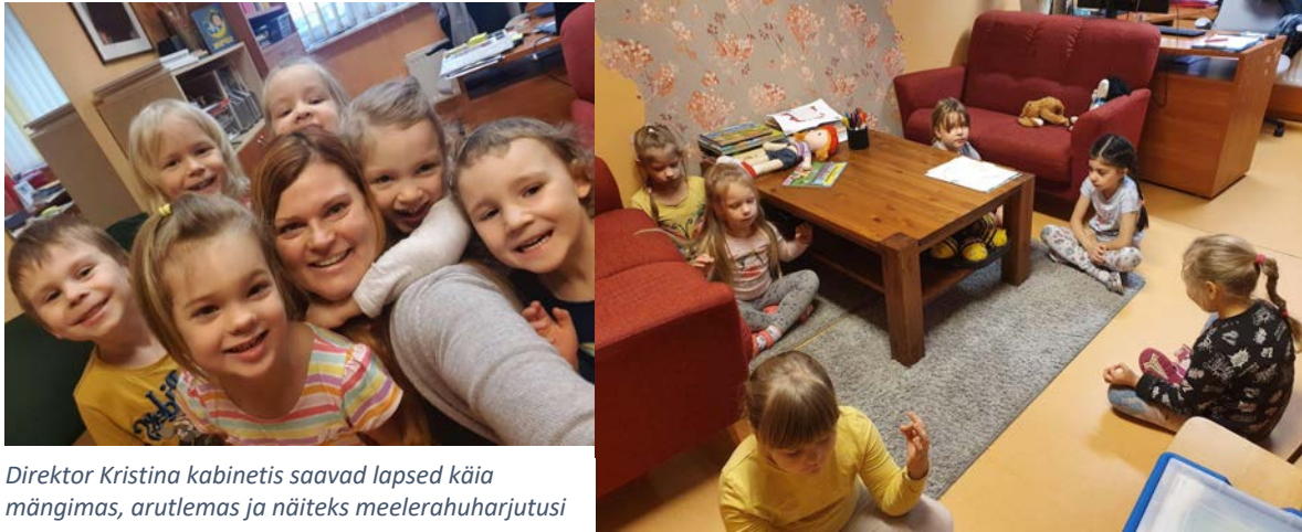
Direktor Kristina kabinetis saavad lapsed käia mängimas, arutlemas ja näiteks meelerahuharjutusi tegemas