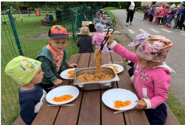
Lapsed ise lõunat serveerimas

Kõik lapsed ei pea kõike ühtemoodi ja samal ajal tegema. Hästi oluline on tajuda last ja mõista, mis just sellel hetkel last kõige paremini toetab ja siin ei saa olla universaalset lahendust, tuleb läheneda igale lapsele paindlikult ja individuaalselt. Näiteks ühes rühmas, kus lapsed alles alustasid lasteaiateed ja kõik lapsed ei olnud veel kohanenud, oli plaan minna väikesele matkale lasteaia ligidal olevasse parki. Ühele lapsele tekitas uude olukorda minek lisa stressi ja ta hakkas nutma ning polnud nõus matkale kaasa minema. Õpetaja lahendas olukorra nii, et jäi selle ühe lapsega lasteaeda ja see võimaldas tal pakkuda lapsele üks-ühele aega, mida see laps just sellel hetkel vajab. Kuna teisi lapsi ei olnud, siis oli õpetajal võimalus luua lapsega hea kontakt. Teised lapsed läksid õpetaja assistentide ja liikumisõpetajaga matkale. Peale seda olukorda, kus see laps sai õpetaja poolt pikemalt individuaalsemat