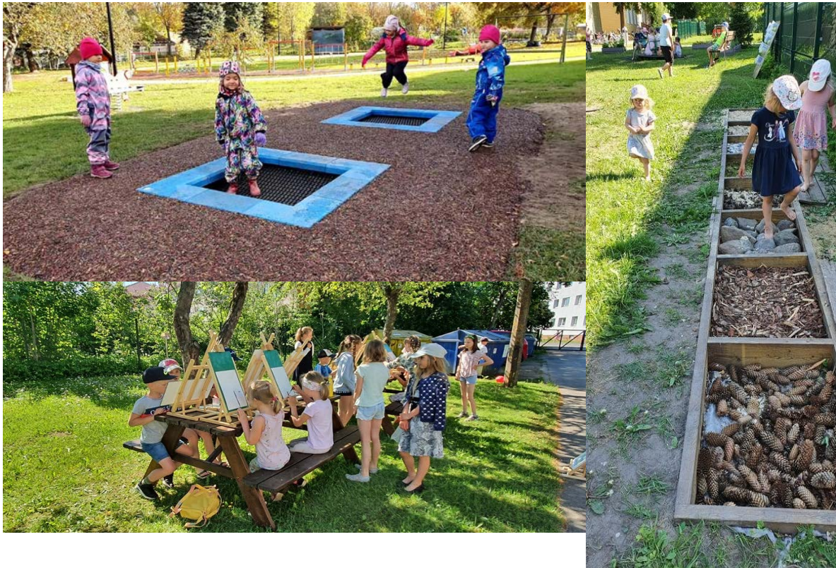
Koos lastega loodud tunnetusrada, kus saab paljajalu erinevaid looduslikke materjale tunnetada

Rühmameeskonnad on loonud lastele turvalise keskkonna, kus laps saab olla tema ise. Head suhted, hoolimine ja ühised head väärtused tagavad lastega ja nende vanematega head koostöosuhted. Iga pere on meile tähtis ja läheneme individuaalselt lahenduste leidmisele. Lasteaia une- või puhkeae g on koostöös lapsevanematega lahendatud selliselt, et lapsed kes ei vaja lõunaund, jäävad seni vaikselt tegevusi tegema. Lapsed, kelle vanemad on otsustanud, et nad peavad puhkama (kuid ei pea uinuma) on rahulikult voodis ja u kl 14 ajal tulevad nad vaikselt teisi segamata vooditest välja. Lapsed, kes uinuvad, nemad ärkavad kl 14:30 - 15:00 vahel, me teeme kardinaid pooleldi lahti, et lapsed saaksid omas tempos rahulikult ärkata. Nii oleme arvestanud kõigi laste vajadustega, väldime kiirustamist ja puhkeaja osa on laste jaoks sujuv ja rahulik. Lapsevanematega koostöö ja paindlikkus rühmapersonali poolt on siinkohal väga tähtis. Meil on tehtud eelnev küsitlus lastevanematele ning vastavalt sellele teame, kellele uni ja puhkamine on väga tähtis, kes võib lihtsalt natukene pikutada ja kes lastest üldse voodisse ei lähe. Küsitlusi teeme iga õppeaasta alguses, et teada saada, kuidas lapse olekut